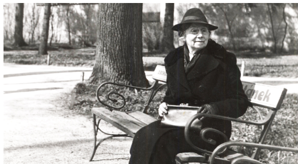
Ľudmila Podjavorinská počas oddychu na lavičke v parku v Novom Meste nad Váhom.